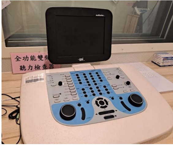
全功能雙頻道 聽力檢查儀