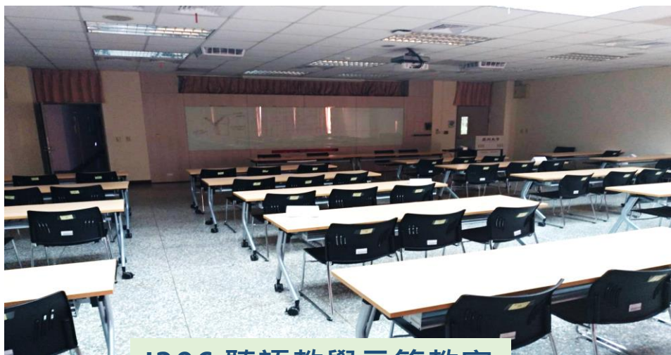
I306 聽語教學示範教室