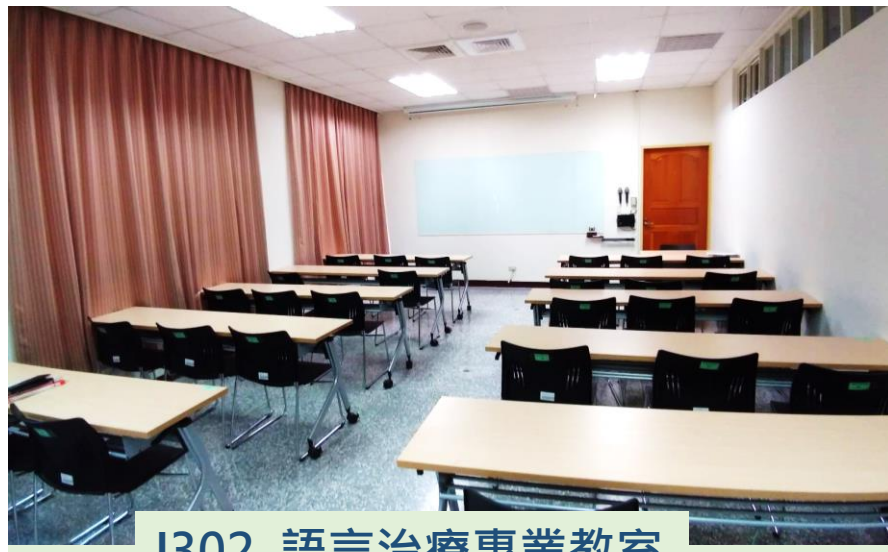
I302 語言治療專業教室