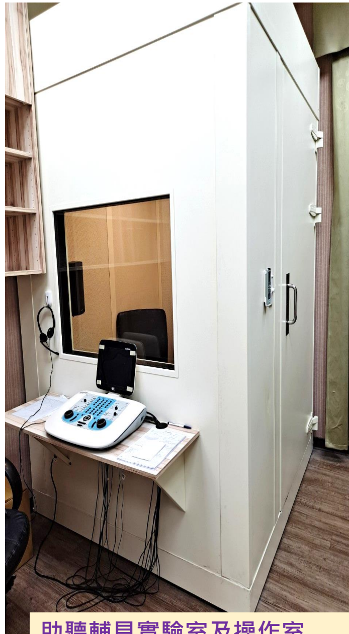
助聽輔具實驗室及操作室