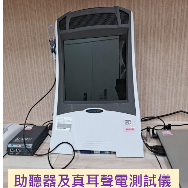
助聽器及真耳聲電測試儀